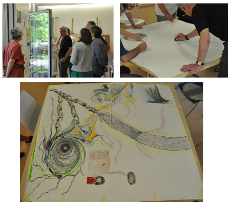
Abbildung 2 Fotos vom AiR Workshop

Ergebnisse: Es wurden XX Interview geführt, die derzeit noch ausgewertet werden. Während des Forschungsprozesses wurden zwei kurze Ausschnitte aus den Interviews genutzt und mithilfe von kunstinformativer Forschung (Arts informed research, kurz: AiR) interpretiert; dazu malte eine interdisziplinäre Gruppe individuelle Bilder sowie ein gemeinsames Bild. Am Ende diskutierte die Gruppe den Prozess und die Ergebnisse (siehe Abbildung 2).